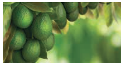
Llenado de fruto